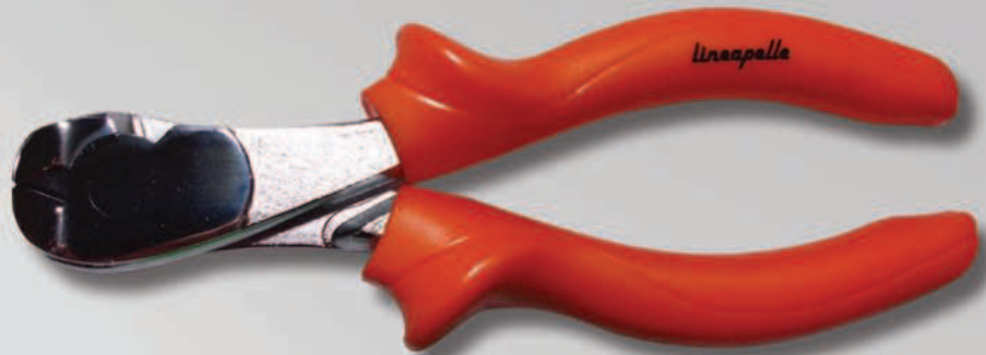
TENAZA CAB.CROMADA PEQUEÑA 713110000180211 180mm