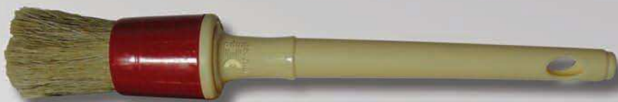
Bocha de plástico.